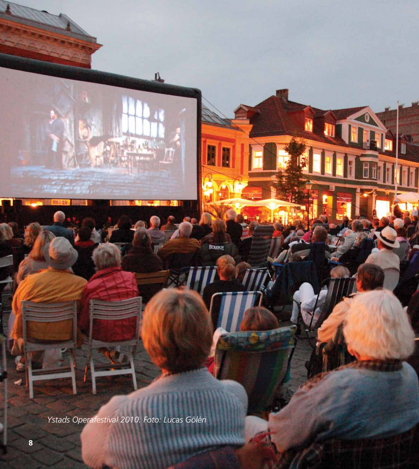
Ystads Operafestival 2010.