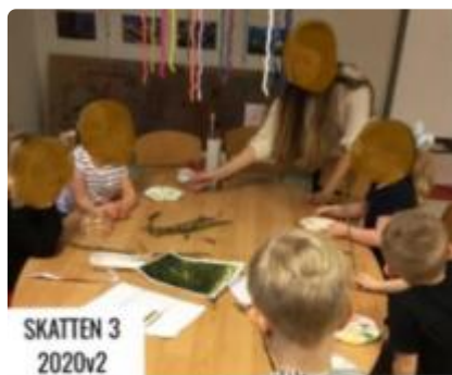
SKATTEN 3 2020v2