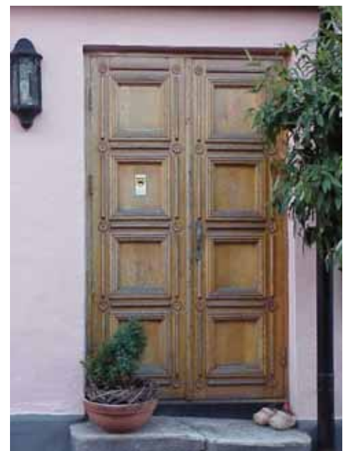
OLOF 22 från N, DÖRR