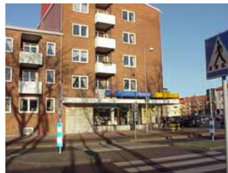
OLOF 21 A från SV