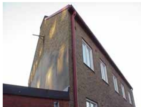
OLOF 23 från NO

fastighet: OLOF 26, hus A. adress: Österleden 3. ålder: 2000. arkitekt / byggm: Kontor. användning: 2 antal våningar: 2 sockel: Betong. väggar: Rött tegel. tak: Sadeltak med rött 1-kupigt tegel. Mansard mot gården med grå falsad slätplåt. detaljer: Blå 4-delade kvadratiska fnster, stora skyltfnster åt väster. Små dekorfnster åt söder, dels med hela rutor, dels som blindfnster. Blå glasad ståldörrar med rundbågig portöppning. Avtrappad tegelgesims, utkragat gördelband. Gården överbyggd med en våning, garage under hela huset. (1927 gjorde Karl Eriksson ett förslag till "Station för Pratts Benzin, med kiosk för tidningar, tobak och choklad". Detta utfördes aldrig, utan 1928 byggde istället Shell bensinstation här. Den revs 1999.)