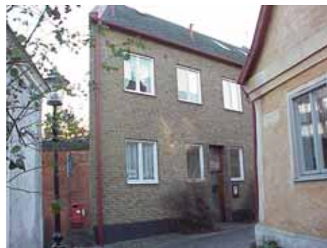
OLOF 23 från N