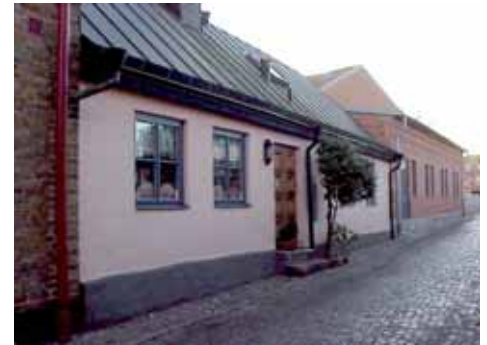
OLOF 22 från NO