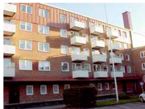
OLOF 21 A från NV

fastighet: OLOF 21, hus B. adress: Österleden 5. ålder: 1960. arkitekt / byggm: HSB. användning: Bostäder. antal våningar: 3 sockel: Grå puts. väggar: Rött tegel. tak: Sadeltak med liten takvinkel, grå trapetsplåt. detaljer: Vita 1- och 2-luftsfnster. Glasade grå ståldörrar. 8 balkonger med vit korrugerad plåt åt söder. Liten uteplats till en lägenhet i sydväst.