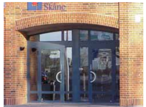
OLOF 26 A från V, PORT