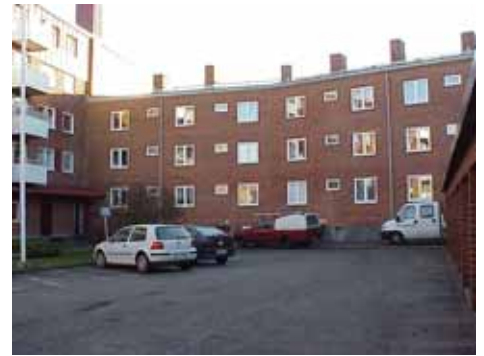
OLOF 21 B från N