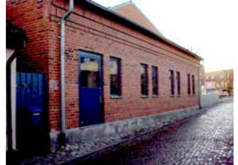
OLOF 26 B från NO