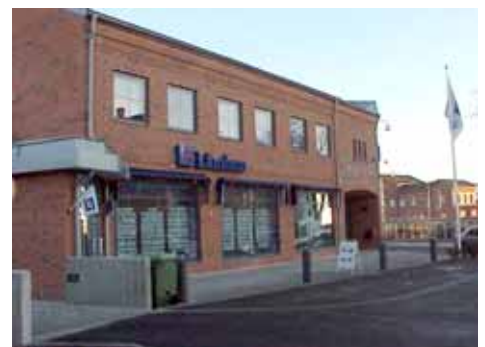
OLOF 26 A från NV