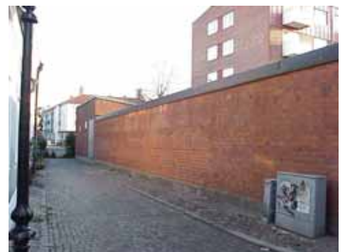
OLOFSGRÄND från V, MUREN SOM TILLHÖR OLOF 21 C