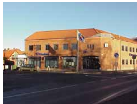
OLOF 26 A från SV

K = 3, M = 3. Viktig genom sitt läge i kvarterets spets.