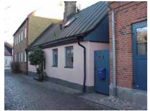
OLOF 22 från V