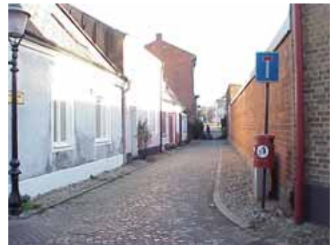
OLOFSGRÄND från V