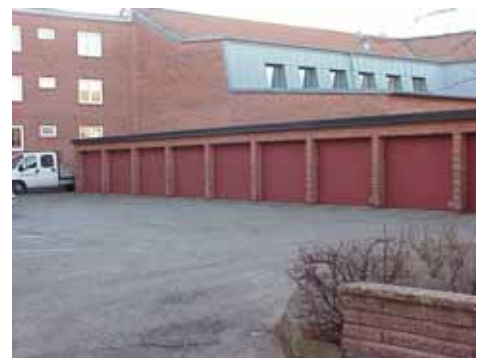
OLOF 21 D från NO

10 garageportar med röd liggande träpanel.