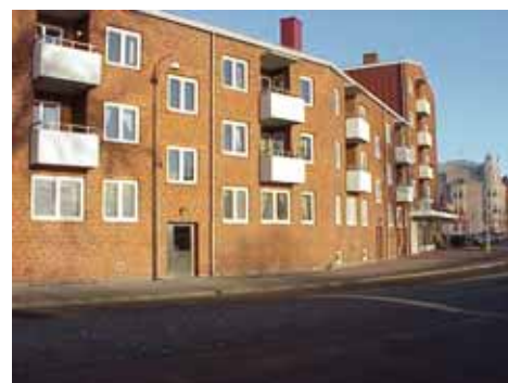
OLOF 21 B från SV

värdering kulturarhistoriskt (K) K = 4, M = 4. miljömässigt (M):