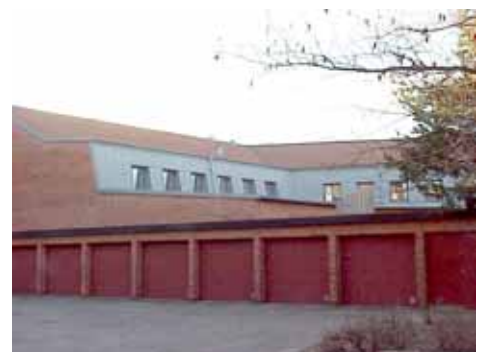
OLOF 26 A från O