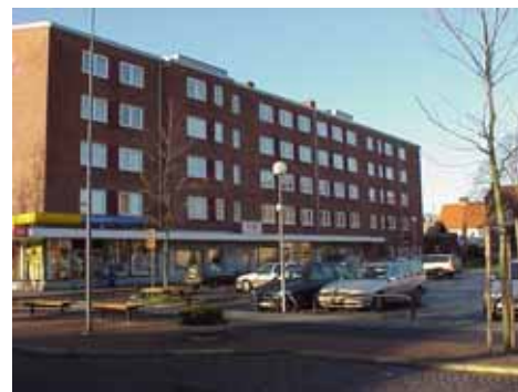
OLOF 21 A från SO

värdering kulturarhistoriskt (K) K = 4, M = 3. miljömässigt (M): Bidrar med sin stora volym till att sluta det ganska vidsträckta torget.