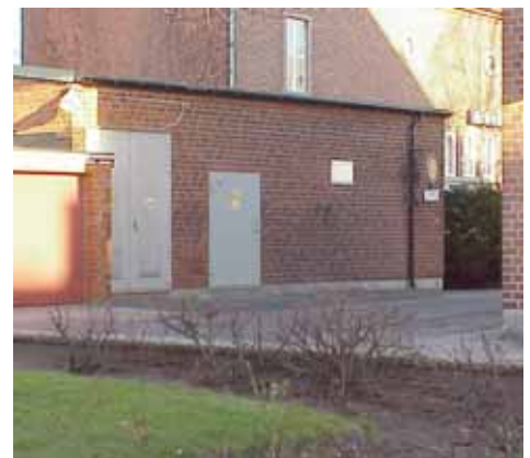
OLOF 21 C från SV

Baksidan mot Olofsgränd är en röd, trist tegelmur som harmonierar dåligt med motsatta sidans små hus. Den bör putsas och färgsättas, kanske i olika fält som kan påminna om de gatuhus som låg här förut.