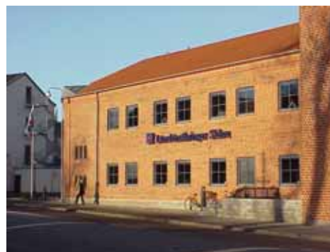
OLOF 26 A från SO