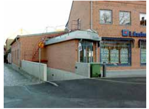
OLOF 26 A och B från V

värdering kulturhistoriskt (K) miljömässigt (M): K = 3, M = 3.