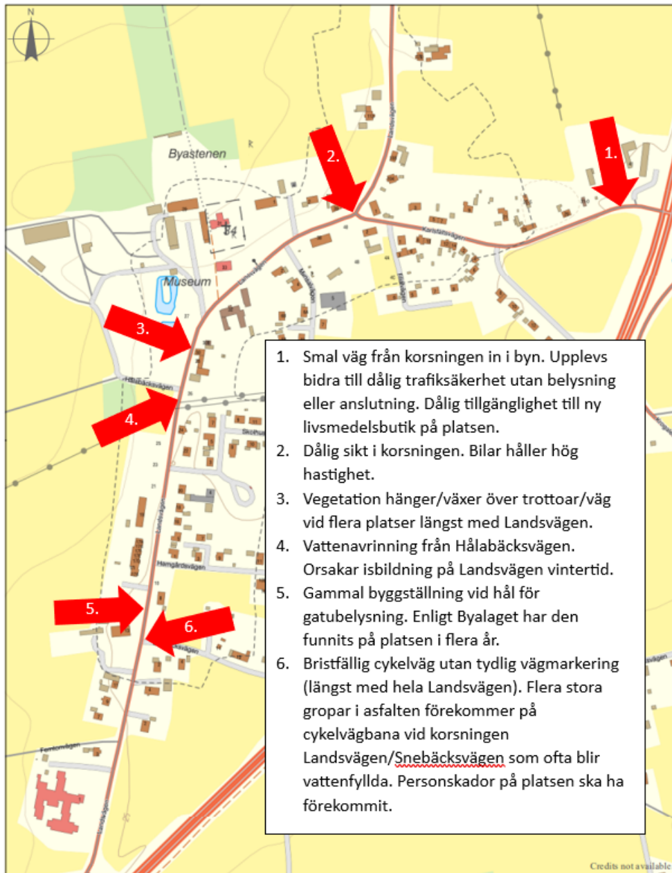
Figur 3. Identifierade brister på Landsvägen/Karlfältsvägen i Stora Herrestad