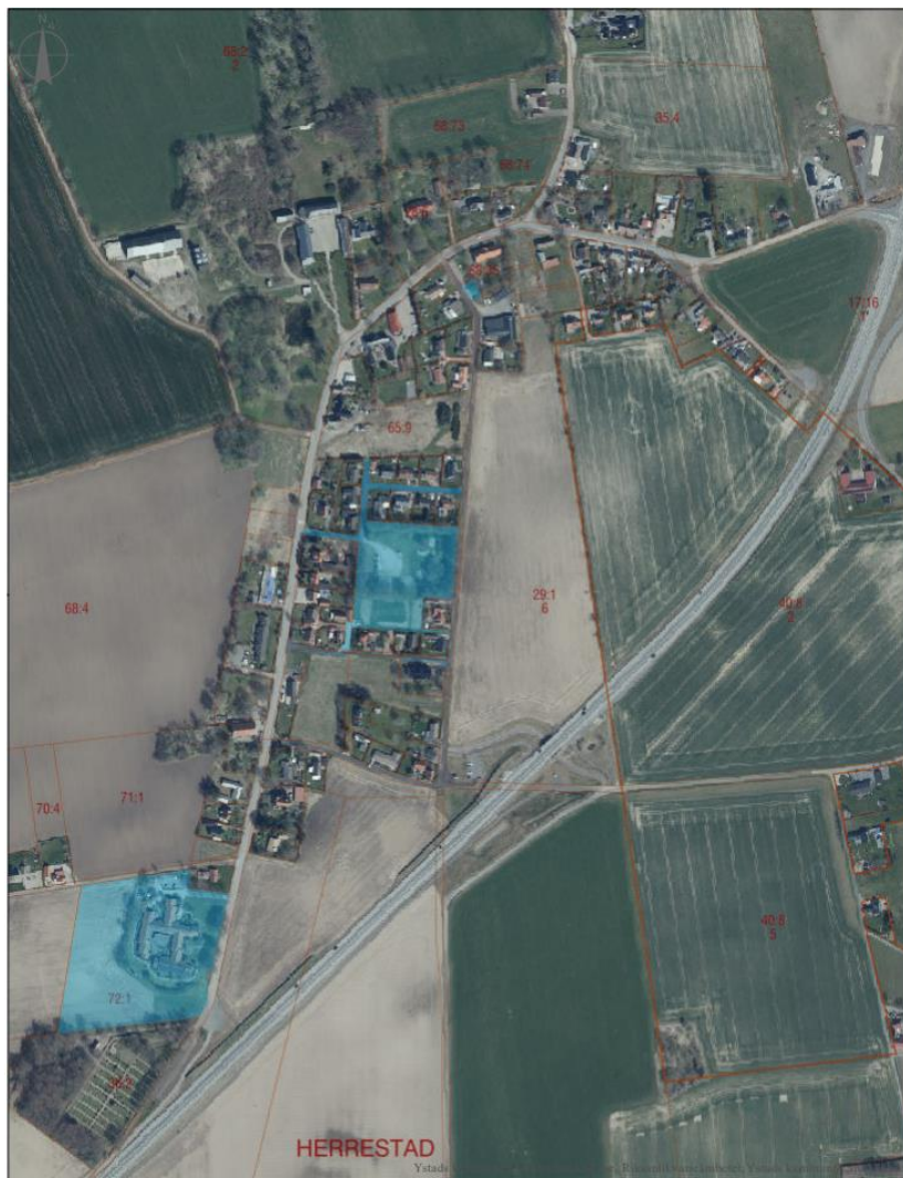
Figur 1. Blåmarkerad mark är kommunalt ägd mark.

I Stora Herrestad är en stor del av marken privatägd. Kommunen äger mark på två platser i byn: Den gamla skoltomten samt det särskilda boendet Solbacken. (Se figur 1.).