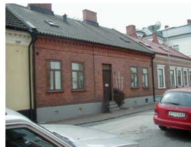
ARESKOUG S 3 från NO