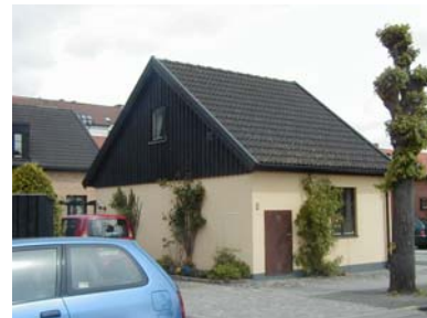
ARESKOUG S 5 B från SV

fastighet: ARESKOUG SÖDRA 7, hus A. adress: Engelbrektsgatan 7. ålder: 1885. Ombyggt 1943, 1948, 1980. arkitekt / byggm: Peter Boisen. Karl Erikson (1943), Bertil Sandin (1948), Herman Herrvik (1980). användning: Bostad. antal våningar: 1½ sockel: Svartmålad puts. väggar: Gulmålad slätputs. tak: Sadeltak, svart 2-kupig betongpanna. detaljer: Vita 2- och 3-lufts spröjsade fönster. Vit lamelldörr med spegelmönster, spröjsat fönster, över- och sidoljus. Vita fönsteromfattningar. Kraftig vit gesims, profilerad och med dubbelt tandsnitt. Två kupor åt söder, klädda med svart plåt.