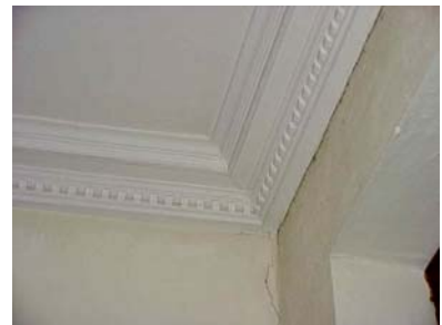
ARESKOUG S 1 A TRAPPHALL GESIMS