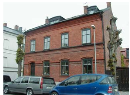
ARESKOUG S 2 B från SO

fastighet: ARESKOUG SÖDRA 2, hus B. adress: Engelbrektskatan 3. ålder: 1890. Ombyggt 1947, 1960, 1987. arkitekt / byggm: Peter Boisen. Tore Johansson (1947), Karl Erikson (1960), Kjell Skantz (1987). användning: Bostäder. antal våningar: 2½ sockel: Gråmålad puts. väggar: Rött tegel. tak: Sadeltak, grå korrugerad eternit. detaljer: Mörkgröna korsdelade fönster. Mörkgrön glasad pardörr med speglar och överljus. Indragna bröstningspartier. Fönsteromfattningar i formtegel. Gesims och gördelband av formtegel med tandsnitt, äggstav och facettlist. Stickbågar. Två kupor mot söder, klädda med svart plåt. Yttertrappa av granit med sidobalustrader.