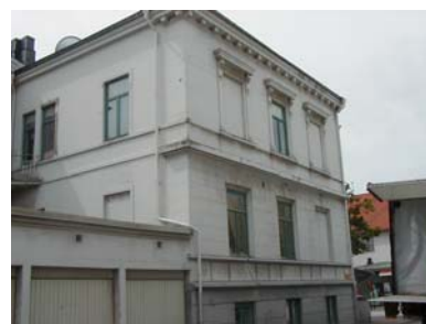
ARESKOUG S 1 A från NO