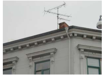
ARESKOUG S 1 A från SV GESIMS