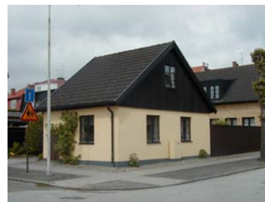
ARESKOUG S 5 B från SO