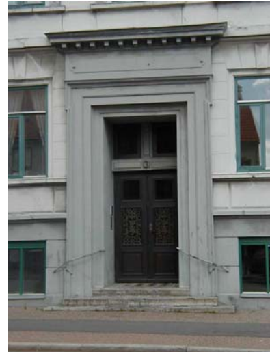
ARESKOUG S 1 A från V PORTAL