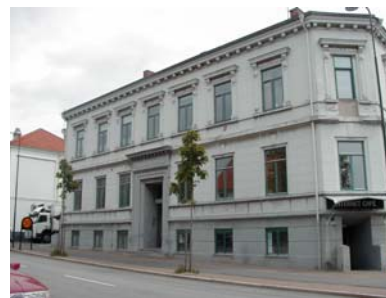
ARESKOUG S 1 A från SV