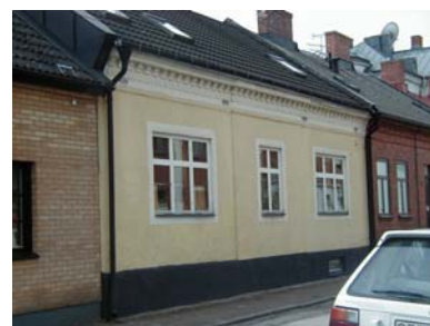
ARESKOUG S 7 från NO