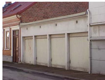
ARESKOUG S 1 B från NV