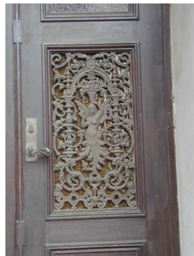
ARESKOUG S 1 A från V DÖRRDEKOR