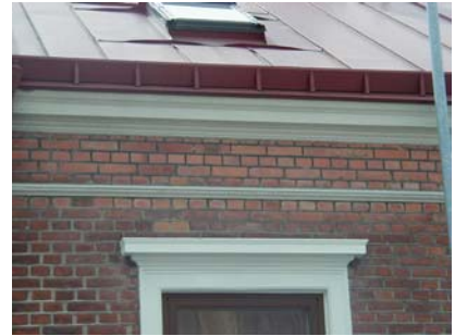
ARESKOUG S 2 A från N LISTER

värdering kulturhistoriskt (K) miljömässigt (M)