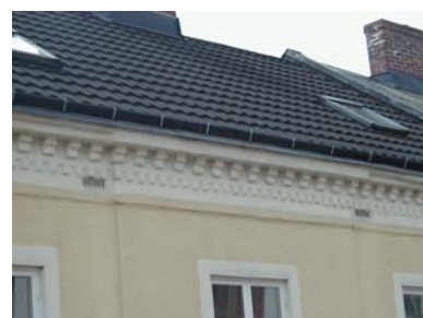
ARESKOUG S 7 från NO GESIMS