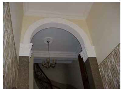
ARESKOUG S 1 A TRAPPHALL VALV