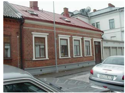
ARESKOUG S 2 A från NO

fastighet: ARESKOUG SÖDRA 2, hus A. adress: Föreningsgatan 4. ålder: 1885. Ombyggt 1987. arkitekt / byggm: Troligen Peter Boisen. Kjell Skantz (1987). användning: Bostad. antal våningar: 1½, 2 mot gård. sockel: Gråmålad puts. väggar: Rött fogstruket tegel. tak: Sadeltak, mansard åt gård, röd falsad plåt. detaljer: Brun 2-lufts fönster med överbåge, mot gård vita. På ovanvåningen spröjsade fönster. Brun 3-delad port med facettspeglar, dekor med kanneleringar och tandsnittslist, fönster och överljus. Mot gård brun port med överljus och stående pärlspont. Brun glasad ramdörr av stående panel. Profilerade port- och fönsteromfattningar i vit puts med kornischer och solbänkar. Vitputsad profilerad gesims och dekorlist. Mot gården avtrappad gesims i tegel med tandsnitt. Frontespis mot gården. Stickbågar. Ståndränna. Portgång genom huset med klinkergolv, bröstningspanel av brun pärlspont och brun pardörr med speglar och råglasfönster.