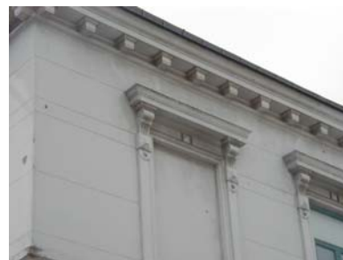
ARESKOUG S 1 A från NO BLINDFÖNSTER