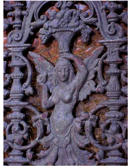
ARESKOUG S 1 A från V DÖRRDEKOR DETALJ