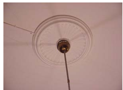
ARESKOUG S 1 A TRAPPHALL LAMPROSETT