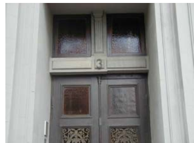
ARESKOUG S 1 A från V ÖVERLJUS