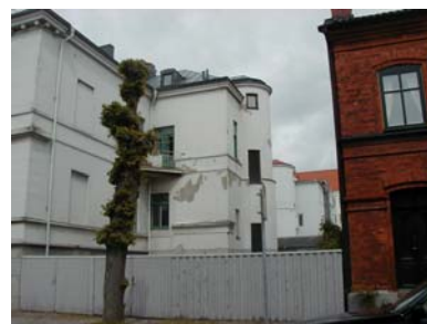
ARESKOUG S 1 A från SO TRAPPTORN