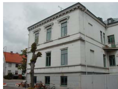
ARESKOUG S 1 A från SO