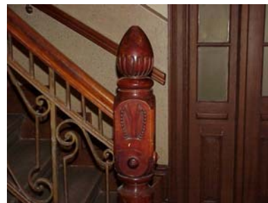
ARESKOUG S 1 A TRAPPHALL RÄCKESSTOLPE