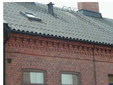
ARESKOUG S 3 från NO GESIMS

fastighet: ARESKOUG SÖDRA 5, hus A. adress: Föreningsgatan 10. ålder: 1982. arkitekt / byggm: Kommunaltekn. Systemvillor AB. användning: Bostad. antal våningar: 1½ sockel: Gråmålad puts. väggar: Gult tegel. tak: Sadeltak, svart 2-kupig betongpanna. detaljer: Mörkbruna 2-lufts spröjsade fönster. Mörkbrun spegeldörr. Enkel avtrappad gesims. Två kupor åt söder, klädda med svart plåt.