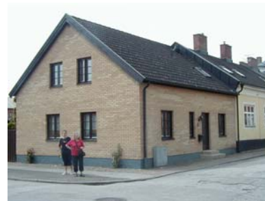
ARESKOUG S 5 A från NO