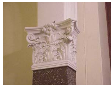
ARESKOUG S 1 A TRAPPHALL KAPITÄL