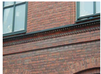
ARESKOUG S 2 B från SO GÖRDELLIST

värdering kulturhistoriskt (K) miljömässigt (M)