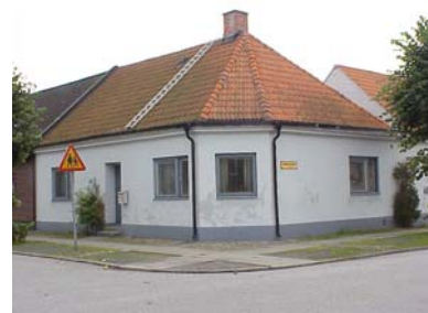
HAAK N. 1 A från NV

fastighet: HAAK NORRA 1, hus A. adress: Engelbrektskatan 18. ålder: 1885. Ombyggt 1915, 1951, 1968. arkitekt / byggm: Henrik Nilsson (1915), Bertil Sandin (1951). användning: Bostad. antal våningar: 1½ sockel: Blåmålad puts. väggar: Vit spritputs. tak: Valmat tak, rött 2-kupigt tegel. detaljer: Blåa hela fönster. Blå diagonalrutig lamelldörr. Avskuret hörn. Profilerad vit gesims. Ståndränna.