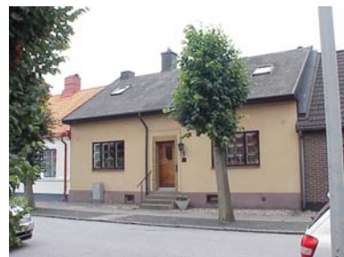
HAAK N. 3 A från NV