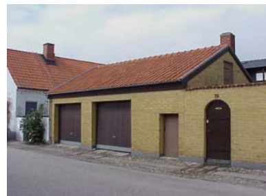
HAAK N. 2 B från SO