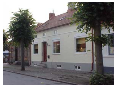
HAAK N. 5 A från NV