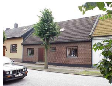
HAAK N. 2 A från NV

fastighet: HAAK NORRA 2, hus B. adress: Lilla Engelbrektskatan 19. ålder: 1886, byggt som bostadshus. Totalt ombyggt 1969. arkitekt / byggm: användning: Garage. antal våningar: 1 sockel: Gråmålad puts. väggar: Gult tegel. tak: Sadeltak, rött 2-kupigt tegel. detaljer: 2 mörkbruna garageportar med stående panel. Rundad port i mur, mörkbrun med stående panel och svarta hängslor i gammal stil.