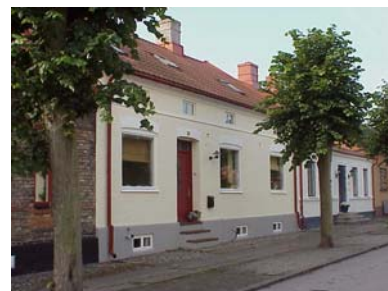
HAAK N. 5 A från NO