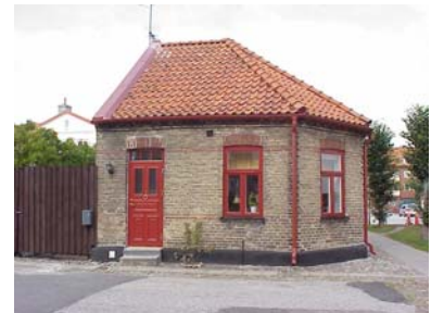
HAAK N. 6 från S