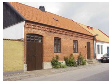
HAAK N. 3 B från SV