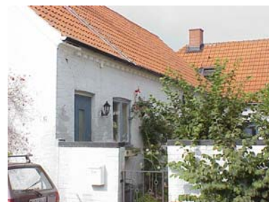
HAAK N. 1 B från SO

värdering kulturhistoriskt (K) K = 2, M = 2. miljömässigt (M)