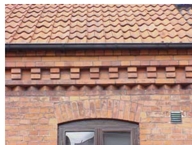
HAAK N. 3 B från S GESIMS