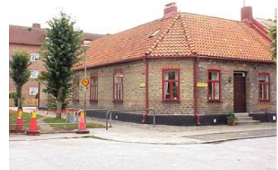
HAAK N. 6 från NO