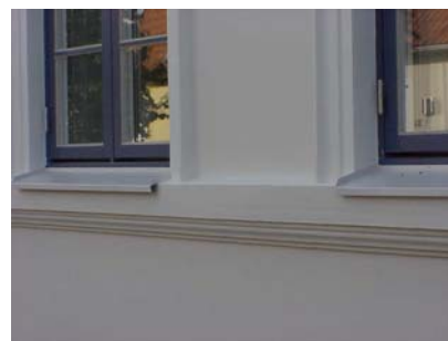
HAAK N. 4 A från NV BRÖSTNINGSLIST

fastighet: HAAK NORRA 4, hus B. adress: Lilla Engelbrektskatan 23. ålder: 1886. Ombyggt 2002. arkitekt / byggm: Olle Bennvid (2002). användning: Förråd. antal våningar: 1 sockel: Blåmålad puts. väggar: Vit slätputs. tak: Sadeltak, rött 1-kupigt tegel. detaljer: Blå spröjsade 2-lufts fönster. Blå pardörr med stående panel och överljus. Utkragande dörrparti. Lisener i hörn och vid entréparti. Enkel slät gesims.