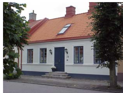
HAAK N. 4 A från NV