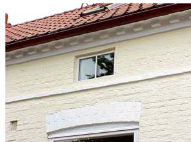
HAAK N. 5 A från NV MEZZANIN

fastighet: HAAK NORRA 5, hus B. adress: Lilla Engelbrektskatan 25. ålder: arkitekt / byggm: användning: Garage, förråd. antal våningar: 1 sockel: väggar: Grå stående träpanel. tak: Pulpettak, grå korrugerad eternit. detaljer: