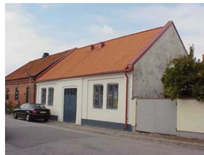
HAAK N. 4 B från SO