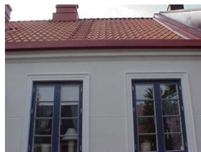
HAAK N. 4 A från N FÖNSTER