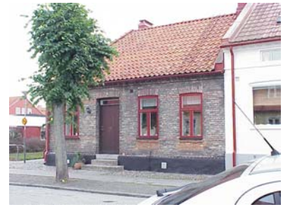
HAAK N. 6 från NV

värdering kulturhistoriskt (K) K = 1, M = 2. miljömässigt (M) Stor betydelse för miljön i parkstråket.