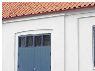
HAAK N. 4 B från SO LISTER