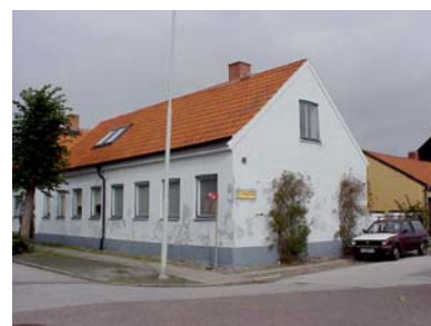
HAAK N. 1 B från SV

fastighet: HAAK NORRA 1, hus B. adress: Lilla Engelbrektskatan 17. ålder: 1885. Ombyggt 1968. arkitekt / byggm: Bostad. användning: Bostad. antal våningar: 1½ sockel: Gråblåmålad puts. väggar: Vit spritputs mot väster och söder, vitmålat fogstruket tegel mot gård. tak: Sadeltak, rött 2-kupigt tegel. detaljer: Blågrå hela och 2-lufts fönster, delvis röda mot gård. Blågrå och röda lamelldörrar med stående panel och fönster. Avtrappad vit gesims mot väster, avtrappad med tandsnitt mot gård. Stickbågar. Ståndränna mot väster.