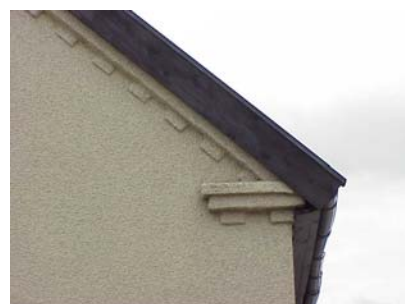
LUNDGREN S 5 B från O GESIMS