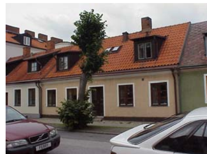
LUNDGREN S 7 A från SO

fastighet: LUNDGREN SÖDRA 7, hus B. adress: Lilla Tobaksgatan 4. ålder: arkitekt / byggm: användning: Garage, förråd. antal våningar: 1 sockel: väggar: Gulbrun stänkputs. tak: Pulpettak, svart korrugerad plåt. detaljer: Mörkbruna hela fönster. Fernissade lamelldörrar. Fernissad garageport med stående panel. Vita dörr- och fönsteromfattningar. Röd taklist av trä. Röd lockpanel i gavelspets.