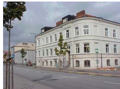
LUNDGREN S 6 A från SV