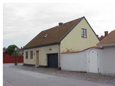
LUNDGREN S 5 B från NV