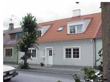
LUNDGREN S 4 A från SO

fastighet: LUNDGREN SÖDRA 4, hus A. adress: Hejdegatan 25. ålder: Ombyggt 1946, 1954, 1996. arkitekt / byggm: Tore Johansson (1946), U. B. Andersson (1954). användning: Bostad. antal våningar: 1½ sockel: Gråmålad puts. väggar: Ljusgrå spritputs. tak: Sadeltak, lätt utsvängt, rött 2-kupigt tegel. detaljer: Vita hela 2-lufts fönster med lösa spröjsar. Vit lamelldörr med spröjsat fönster. Avtrappad vit gesims. Vita dörr- och fönsteromfattningar. Två kupor mot söder med vit lockpanel och tegeltak. Yttertrappa av kalksten.