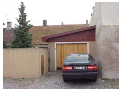
LUNDGREN S 7 B från N