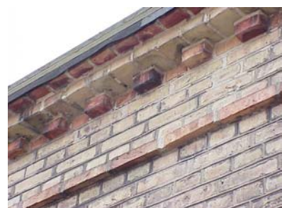
LUNDGREN S 3 B från NV GESIMS