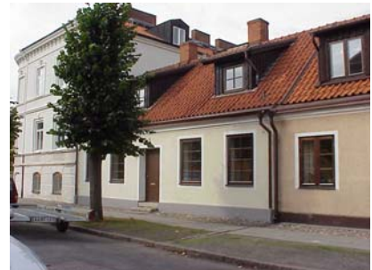
LUNDGREN S 6 B från O