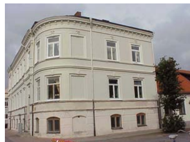
LUNDGREN S 6 A från S