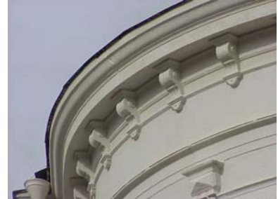
LUNDGREN S 6 A från S GESIMS