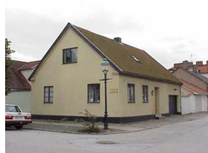
LUNDGREN S 5 B från NO