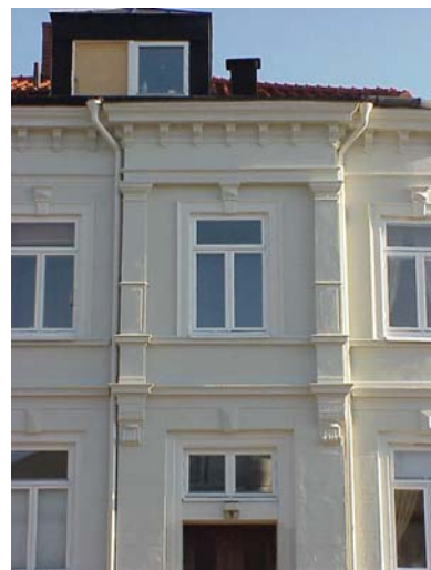
LUNDGREN S 6 A från V RISALIT