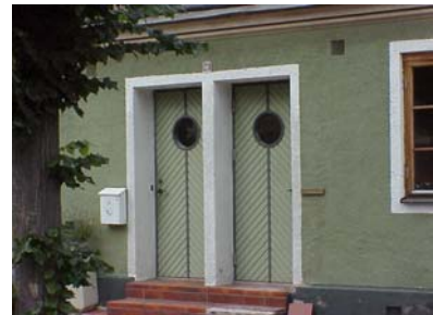
LUNDGREN S 3 A från SO DÖRRAR

fastighet: LUNDGREN SÖDRA 3, hus B. adress: Lilla Tobaksgatan 6. ålder: 1887. arkitekt / byggm: Peter Boisen. användning: Bostad. antal våningar: 1 sockel: Gråmålad puts. väggar: Gulgrått fogstruket tegel, gavlarna i grå puts. tak: Sadeltak, svart papp. detaljer: Gröna 2-lufts fönster. Grön parport med liggande pärlspontpanel och överljus. Avtrappad gesims med tandsnitt i rött tegel. Stickbågar och dekorrande i rött tegel. Ankarjärn på gavlarna.