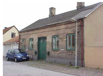
LUNDGREN S 3 B från NV