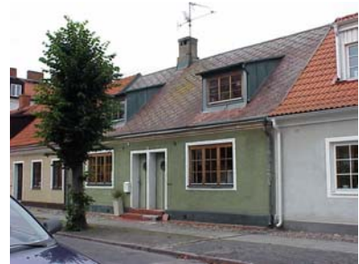
LUNDGREN S 3 A från SO