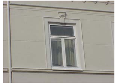
LUNDGREN S 6 A från S FÖNSTER