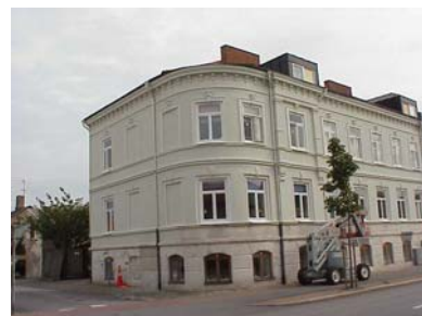
LUNDGREN S 6 A från NV