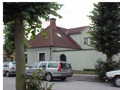
LUNDGREN S 5 A från NO

fastighet: LUNDGREN SÖDRA 5, hus B. adress: Lilla Tobaksgatan 10. ålder: 1884. Ombyggt 1980. arkitekt / byggm: Peter Boisen. användning: Garage och rörelse. antal våningar: 1½ sockel: Svartmålad puts. väggar: Beige stänkputs. tak: Sadeltak, rött 2-kupigt tegel. detaljer: Svarta 2-lufts spröjsade fönster. Brun lamelldörr med stående panel och överljus av glasblock. Mörkbrun låg garageport med rutmönstrad plåt. Avtrappad gesims med tandsnitt. Överputsat ankarjärn mot väster.