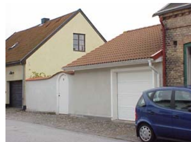
LUNDGREN S 4 B från NV

fastighet: LUNDGREN SÖDRA 4, hus B. adress: Lilla Tobaksgatan 8. ålder: 1954. Ombyggt 1996. arkitekt / byggm: U. B. Andersson. användning: Garage, förråd. antal våningar: 1 sockel: Gråmålad puts. väggar: Ljusgrå spritputs. tak: Sadeltak, rött 2-kupigt tegel. detaljer: Vit garageport med rutmönstrad plåt. Vit rundad port med stående panel. Ljusgrå putsad mur, krönt av taktegel. Vita dörromfattningar.