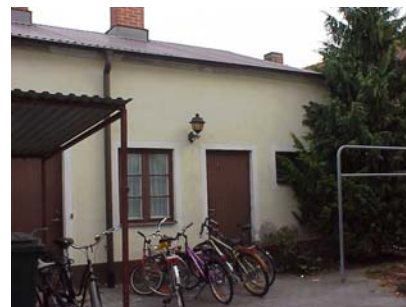
LUNDGREN S 6 C från NV

fastighet: LUNDGREN SÖDRA 7, hus A. adress: Hejdegatan 21. ålder: Före 1902. Ombyggt 1979. arkitekt / byggm: användning: Bostad. antal våningar: 1½ sockel: Brunmålad puts. väggar: Gulbrun stänkputs. tak: Sadeltak, rött 1-kupigt tegel. detaljer: Mörkbruna 2-lufts spröjsade fönster. Mörkbrun pardörr med enkla speglar och råglasfönster. Vit profilerad gesims. Vita dörr- och fönsteromfattningar. Två kupor åt söder med brun lockpanel. Yttertrappa av kalksten Ståndränna. Farstu åt norr med pulpettak av svart papp.