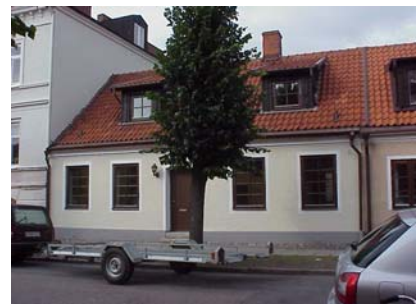
LUNDGREN S 6 B från SO