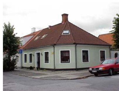
LUNDGREN S 5 A från SO