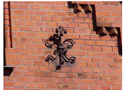
UPPENDICK N. 1 A från V, ANKARJÄRN