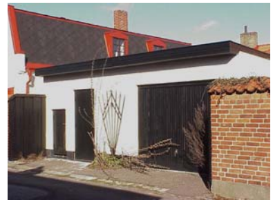
UPPENDICK N. 10 B från SO

värdering kulturhistoriskt (K) miljömässigt (M) K = 5, M = 4.