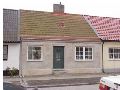
UPPENDICK N. 3 A från N

värdering kulturhistoriskt (K) miljömässigt (M) K = 2, M = 3.