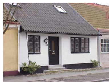
UPPENDICK N. 10 A från NO

värdering kulturhistoriskt (K) miljömässigt (M) K = 4, M = 3.