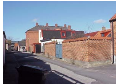
LILLA HEJDEGATAN från O