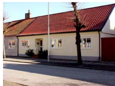
UPPENDICK N. 8 A från NV