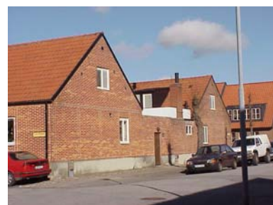
UPPENDICK N. 6 A och B från SO