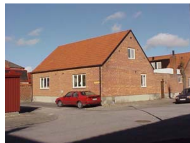
UPPENDICK N. 6 B från SO