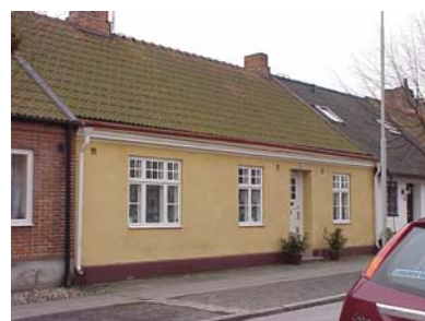
UPPENDICK N. 5 från NO