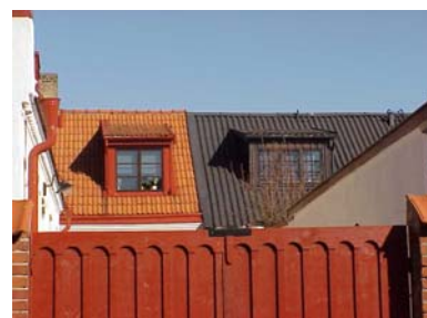
UPPENDICK N. 3 A o 10 A från S KUPOR