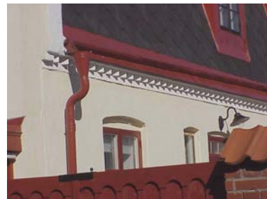
UPPENDICK N. 3 B från SO, GESIMS

fastighet: UPPENDICK NORRA 5, hus A. adress: Hejdegatan 44. ålder: Ombyggt 1921, 1950. arkitekt / byggm: Henrik Nilsson (1921), Bertil Sandin (1950). användning: Bostad. antal våningar: 1½ sockel: Mörkt vinröd puts. väggar: Gul spritputs. tak: Sadeltak, rött 2-kupigt tegel. detaljer: Vita 4- och 6-lufts spröjsade fönster, övre delen i smårutor. Vit ramdörr med fyllning och spröjsat råglasfönster. Vit profilerad gesims. Ståndränna. Yttertrappa av granit. Vita fönsteromfattningar mot gård. Kupa mot söder, klädd med brun plåt. Vinkelbyggnad mot gården har vitputsad gavel och brutet pulpettak. Mur av rött tegel mot söder, krönt av 1-kupigt rött taktegel. Blå port av plåt.