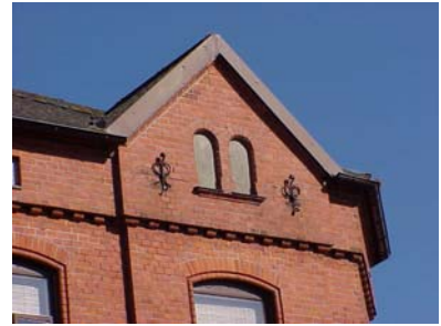
UPPENDICK N. 1 A från V, FRONTESPIS 2