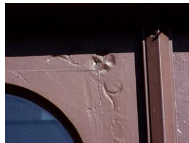
UPPENDICK N. 1 A från V, PORTDEKOR