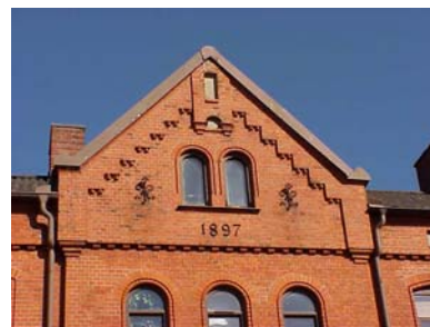
UPPENDICK N. 1 A från V, FRONTESPIS