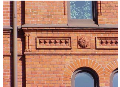
UPPENDICK N. 1 A från V, GÖRDELBAND