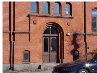
UPPENDICK N. 1 A från NV, PORTAL