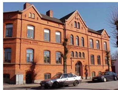
UPPENDICK N. 1 A från NV