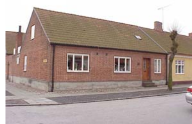
UPPENDICK N. 6 A från NO

värdering kulturhistoriskt (K) miljömässigt (M) K = 4, M = 3.