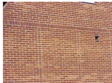
UPPENDICK N. 6 B från O, URNING

fastighet: UPPENDICK NORRA 8, hus A. adress: Hejdegatan 38. ålder: Ombyggt 1872, 1887, 1946. arkitekt / byggm: Tage Billgren (1946). användning: Bostad. antal våningar: 1½ sockel: Gråmålad puts. väggar: Gul puts, gul lockpanel mot gård och i gavelspets. tak: Utsvängt sadeltak, rött 1-kupigt glaserat tegel. (eller plåt?) detaljer: Vita, breda 1-lufts fönster med lösa spröjsar. Vit lamelldörr med spegelmönster och sidoljus. Avtrappad gesims. Indragen entré. Yttertrappa med ljusbrun klinker. Utbyggnad mot söder i ljusgul lockpanel, med pulpettak av grå papp.