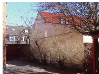
UPPENDICK N. 8 A från SV