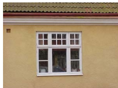
UPPENDICK N. 5 från N, FÖNSTER