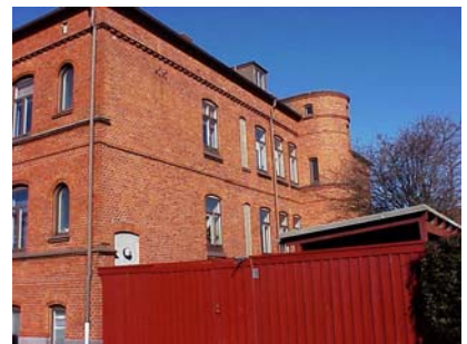
UPPENDICK N. 1 A från SO