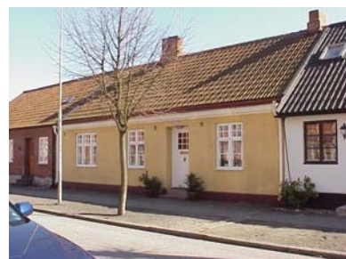
UPPENDICK N. 5 från NV