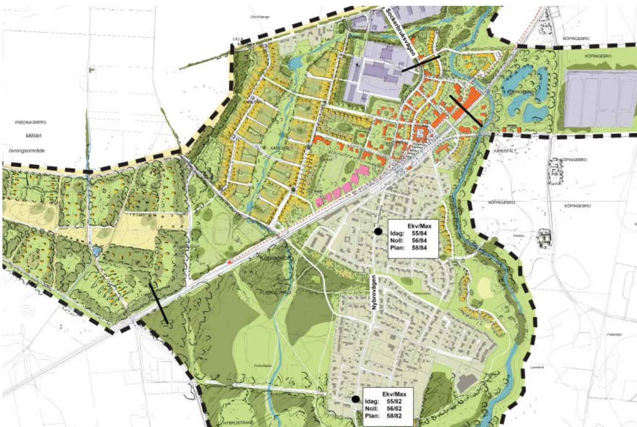
Beräkningspunkter för buller. Linjerna redovisar de sektioner där beräkningar gjorts för hur stora avstånd från väg, respektive järnväg som behöver hållas för att klara riktvärdena utan skyddsåtgärder.

Vid nybyggnad av bostäder utmed järnvägen blir den maximala bullernivån dimensionerande för behov av bullerdämpande åtgärder. För att klara riktvärdet 70 dBA maximalnivå vid fasad, bör husen ligga minst 55 m från spåret om inga bullerdämpande åtgärder vidtas. Genom att placera verksamheter, som kan fungera som bullerskydd, närmast järnvägen kan järnvägens bullerstörningar minskas. Även för det planerade fritidshusområdet väster om Köpingsbro är den maximala bullernivån dimensionerande. Beräkningar visar att bebyggelsen bör ligga ca 200 m från järnvägen för att riktvärdet utomhus på uteplats ska klaras, om inga bullerdäm-