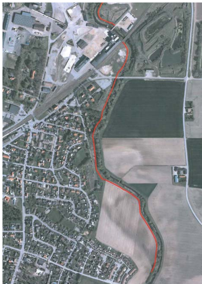
Bild 2. Skredrisk markerat på karta, ca 10 meter från dikeskrön.

Studien har även inkluderat hur påverkan blir på Nybroån vid havsnivåhöjning +2,5 meter. Resultatet av simuleringen visar att vattennivån i havet inte tycks påverka översvämningsrisken vid exploateringsområdet på något betydande sätt. Gränsen för havets dämmande effekt tycks vara den ”fisktrappa” som ligger knappt 500 m nedströms det undersökta exploateringsområdet. Som ett resultat av utredningen har föreslagna bebyggelseområden justerats sedan samrådsskedet.