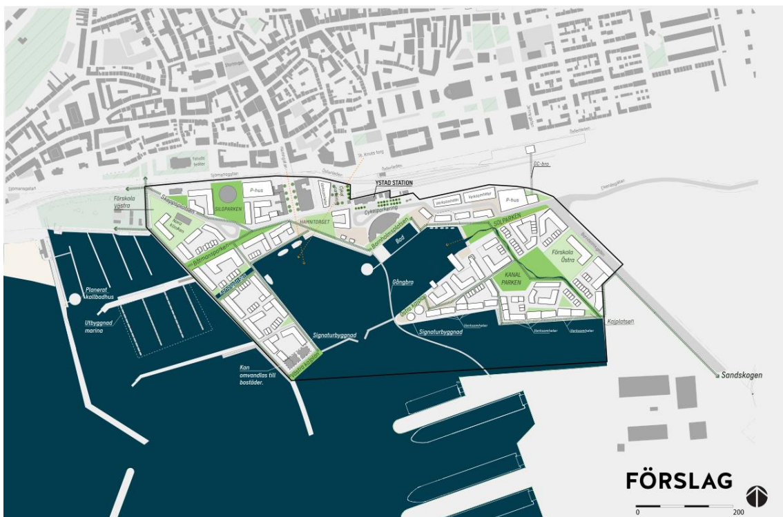
Figur 3: Strukturplan för planförslaget (från utkast till planprogram) framtagen av Sweco (2019-01-25).

Planförslaget innebär en utbyggnad av hamnområdet närmast tätorten. Planförslaget innebär också att antalet anlöp ökar från idag tillståndsgivna 4100 till 10000. Både väg- och järnvägstrafik ökar i planförslaget jämfört med nuläget, men antalet godståg är samma som i nuläget. I Figur 3 visas planområdets gräns och förslag på strukturplan (Sweco, 2019-01-25) för planområdet.