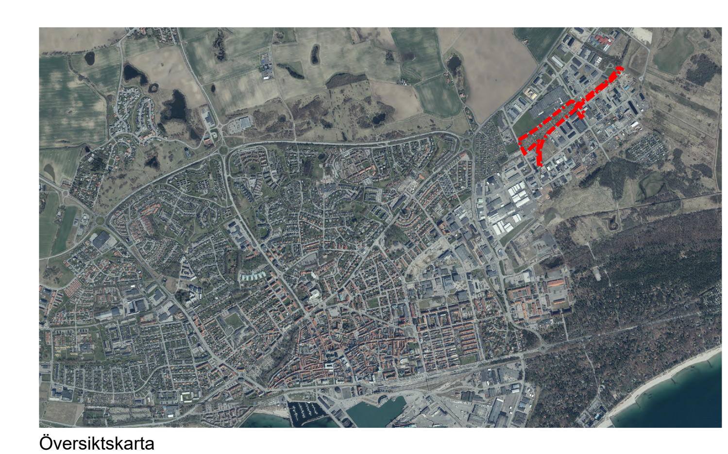
Plankarta utsnitt 1