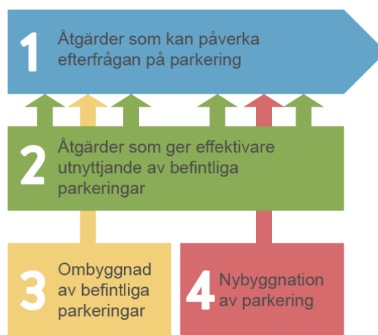
Figur 1. Schematisk beskrivning av de fyra stegen i fyrstegsprincipen.