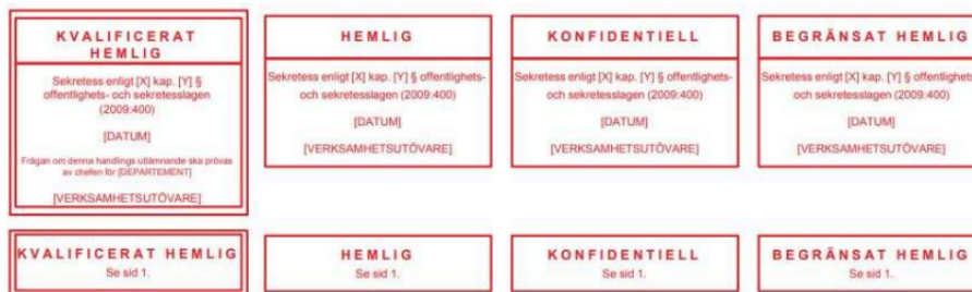
Figur 1 – exempel på hur anteckningar kan formos för offentliga verksamhetsutövare (Säkerhetspolisen, 2019)